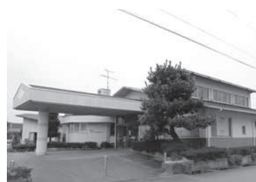
旧デイサービスセンター