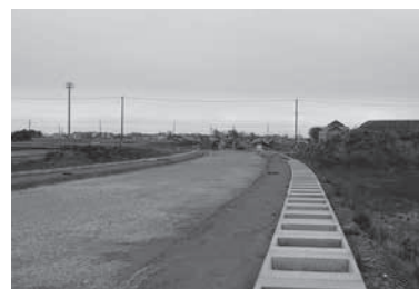
中林土地区画整理事業