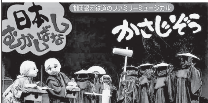
劇団銀河鉄道のファミリーミュージカル

毎年おなじみとなった「ぬいぐるみミュージカル」。今年は長年語り継がれ親しまれてきた日本の昔話をお届けします。親子で素敵な時間をお過ごし下さい！