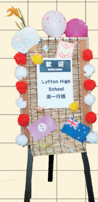
会場に置いたウェルカムボード