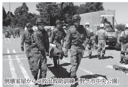
倒壊家屋からの救出救助訓練（野々市中央公園）