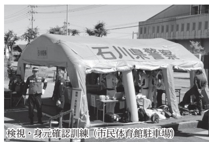
検視・身元確認訓練（市民体育館駐車場）