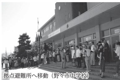
拠点避難所へ移動（野々市中学校）

午前8時の緊急地震速報を合図に、町内会ごとに定められた一時的避難場所へ避難。避難状況を把握し、所在が不明の世帯の家を見に行くなど安否を確認しました。その後の時間を利用して、消火訓練や炊き出し訓練などの個別訓練を実施する町内会も。市内10カ所の拠点避難所では、救急救命講習など災害時に役立つ行動を学びました。