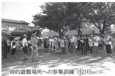
一時的避難場所への参集訓練（位川）