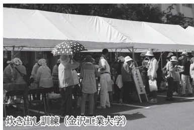
炊き出し訓練（金沢工業大学）