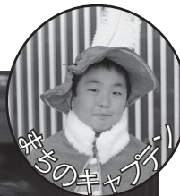
まちのキャプテン