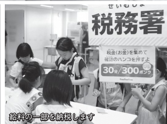
給料の一部を納税します