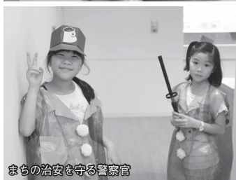
まちの治安を守る警察官