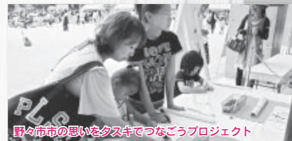
野々市市の思いをタスキでつなごうプロジェクト