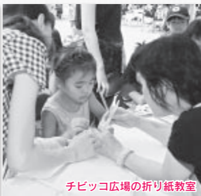
チビッコ広場の折り紙教室