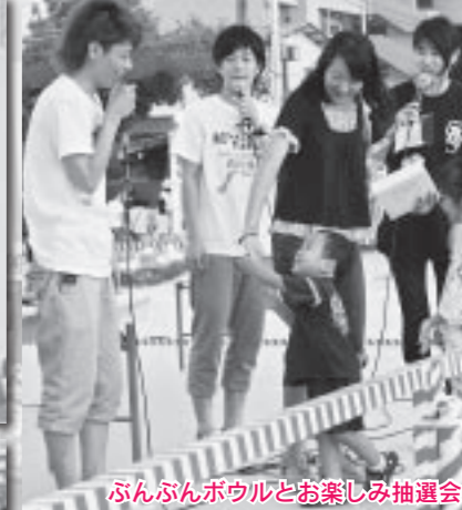
ふんぶんボウルとお楽しみ抽選会