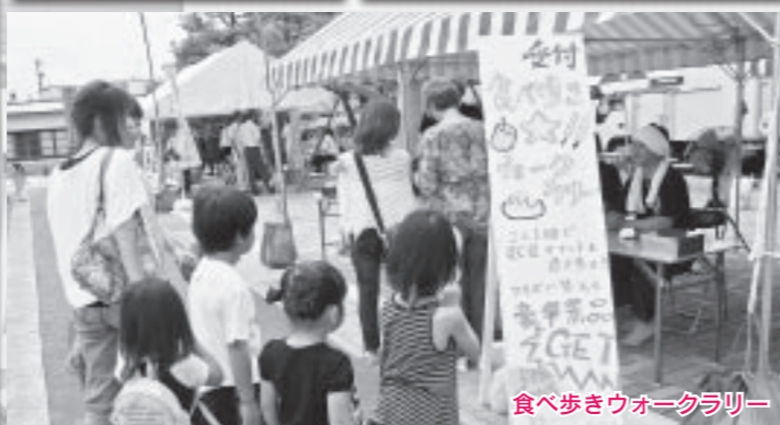
食べ歩きウォークラリー