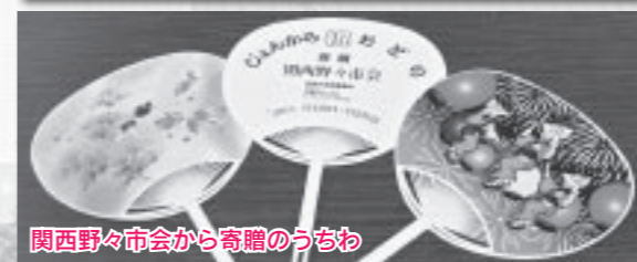
関西野々市会から寄贈のうちわ