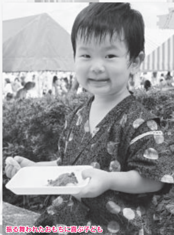
振る舞われたおもちに喜び子ども