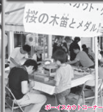
ボーイスカウトコーナー

今年のじょんからまつりも盛会に終えることができました。町民の皆さんのご理解とご協力に感謝し、心から御礼申し上げます。 野々市じょんからまつり実行委員会