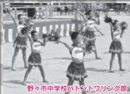
野々市中学校バトントワリング部