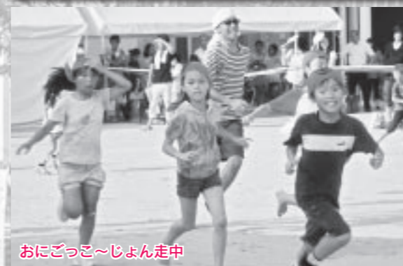
おにごっこ〜じょん走中