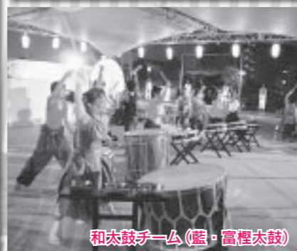
和太鼓チーム (藍・富樫太鼓)