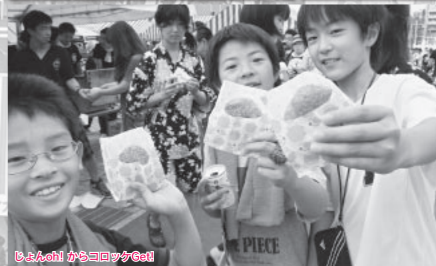
じょんoh! からコロツケGet!