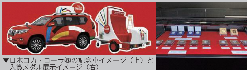
▼日本コカ・コーラ(株)の記念車イメージ(上)と入賞メダル展示イメージ(右)

日本コカ・コーラ(株)の記念車や聖火リレートーチと記念撮影できるほか、カレード内に過去のオリンピック・パラリンピックの入賞メダルや記念貨幣を展示します。また、聖火ランナーの出発を盛り上げるため、野々市太鼓 結と野々市中学校吹奏楽部が演奏を披露します。