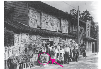
開店記念祝いに贈られた「猩々」

喜多家は、江戸時代から油の製造販売を、明治時代から昭和50年頃まで酒造業を営んでいました。中でも日本酒「猩々」の銘柄は地元でよく親しまれており、秋祭りをはじめとしたさまざまな場で「猩々」が振る舞われていたことが、写真などの記録から分かります。現在喜多家には、当時使用していた酒造りに関する道具が展示されています。