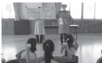
保育園での食育の様子

野々市市では、食を通じた健康づくりのボランティア「食生活改善推進員（食改さん）」が健康的な食事について知ってもらうために、食育講座などさまざまな活動に取り組んでいます。YouTubeをぜひ見てください。