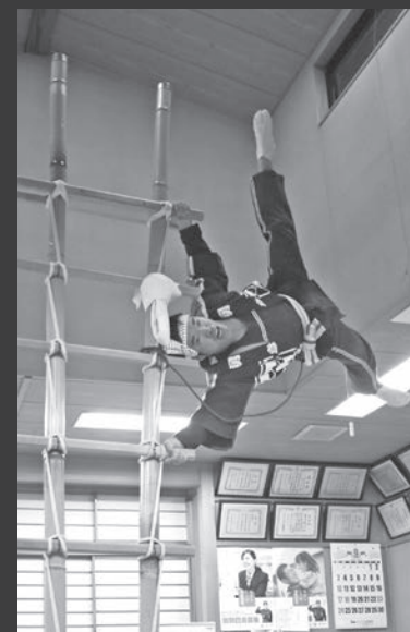
練習に励む第2分団の団員。じょんからまつりなど地域行事での演技や警備も、消防団の重要な活動。

野々市じょんからまつりや出初式などで披露される「はしご登り」。消防団員で構成される「勇鷲会」により、野々市では20年以上前から続いています。10人の団員たちが支える約7メートルのはしごの上で、登り手が23の演技を披露。足のつま先や腰のみで体を支えたり、ぐるりと体を回転させたりと、中