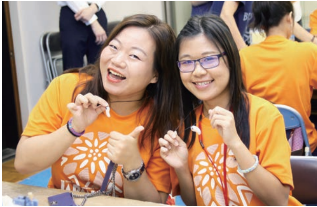
オリジナルアクセサリーの出来栄に、みんなにっこり。