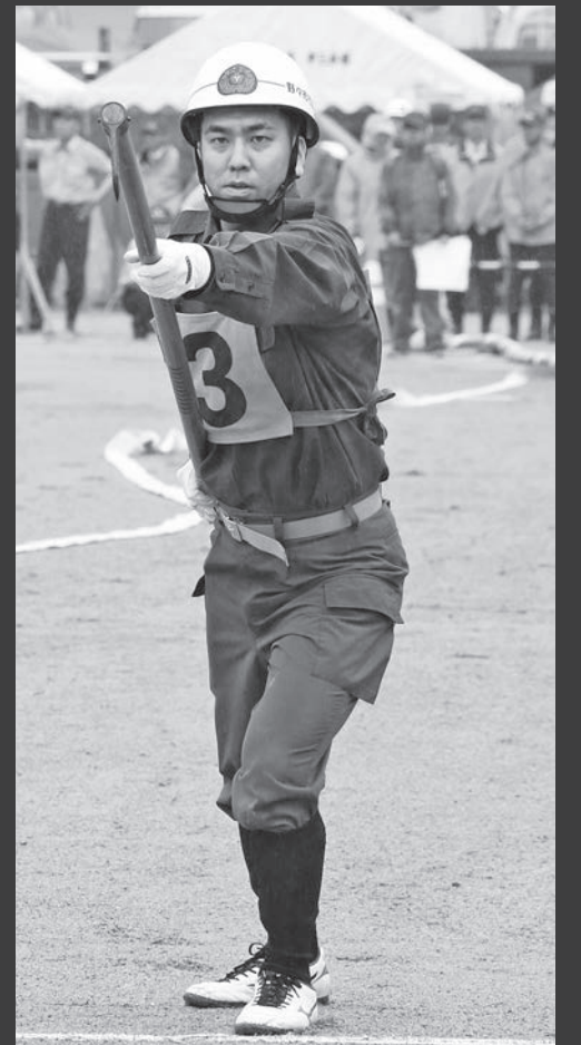
年に一度、消防技術を競う訓練大会に挑む第3分団。仕事が終わった後に行われる大会前の訓練は厳しい。

動を行います。消防団は、地域の人々や地形に詳しいことや素早く出動できることなど、地域に住む市民だからこそ利点を生かして活躍しています。実際の消火活動を想定し、動作の正確さが要求される訓練を行い、消火活動での実績につながっています。また、消火栓・ポンプ車の点検や警戒パトロールなど、地道な活動も災害に備えて欠かせません。