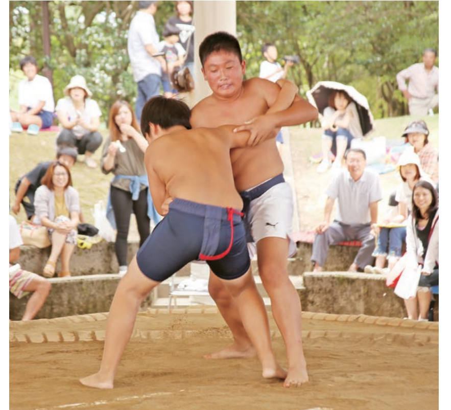
一進一退の攻防を繰り広げる児童たち

また、土俵際に追い込まれても必死でこらえ、相手が強くてもあきらめずに戦う小さな力士の姿は見る者を熱くさせ、保護者らが見守る観客席からは大きな声援が飛んでいました。