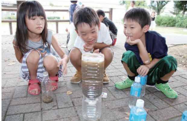
貴重な水と、その水を浄化する自然。これからも大切にしましょう。

8月21日(月)には市ふるさと歴史館で勾玉作り体験などが行われ、留学生たちは真剣な面持ちで勾玉制作に取り組みました。完成した勾玉を掲げた参加者からは「楽しかった」「もう一個作りたい」など歓喜の声が聞かれ、歴史を感じる充実した時間を過ごしました。