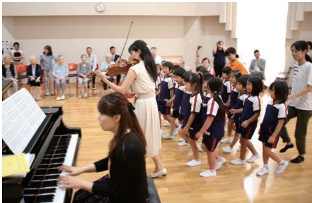
ほのみこども園では曲に合わせて、子どもたちと一緒に進行!

8月17日(木)と22日(火)に、つばきクラブにて市内小学生を対象に環境保全体験教室を開催しました。学習のテーマは「水」。児童らは「地球上の水のうち、私たちの使える水は何%?」「水がきれいになるまでどのくらい時間がかかる?」などのクイズに挑戦しました。その後、ペットボトルに落ち葉や石、土などを詰めてろ過器を作り、泥水を入れてきれいになるかを実験。透明になった水を見た児童たちは「すごい、きれい!」と驚き、他の班と水の透明さを比べ合っていました。