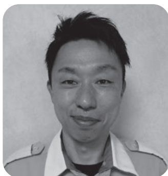
①西 大樹 (主幹) ②平成12年 (16年目) ③挿管・薬剤・二処置