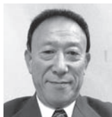
南 武氏 (聴覚) FAX 248-1855