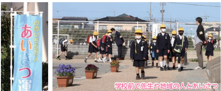
学校前で先生や地域の人とあいさつ