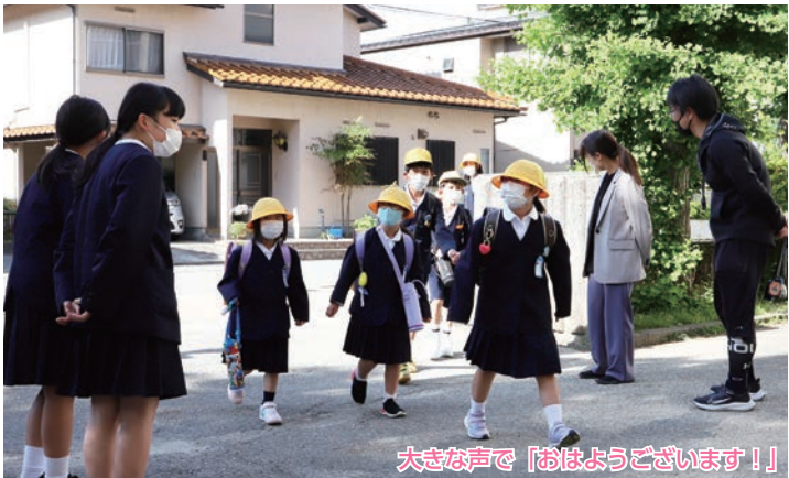
大きな声で「おはようございます！」