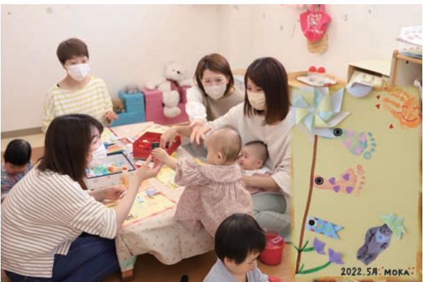
かわいい足型で作った作品は、成長の記録にもなりますね。

地域の子育て支援センターでは、このようなイベントがたくさん行われています。本紙の「子育て応援ひろば」を参考に、ぜひ足を運んでみてください。