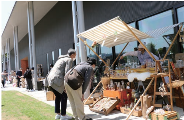
6月25日(土)、26日(日)には「骨董・古本市」を開催予定！