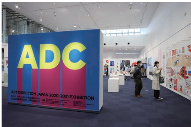
ロゴやCM・広告など、どこかで一度は目にした作品も多数。