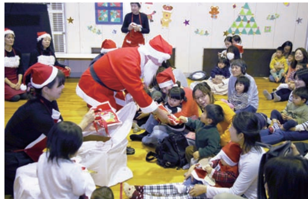
煙突がなくても大丈夫。フォッフオッフオッフ

12月7日(木)、中央児童館にちょっぴり気の早いサンタクロースがやってきました。未就園児を対象としたクリスマス会は大盛況で、会場は溢れんばかりの親子でにぎわいました。帽子や衣装で着飾った小さなサンタクロースたちのかわいらしい姿もちらほら。クリスマスソングやハンドベル演奏など、リズムに乗って楽しめる多彩なアトラクションが披露され、子どもたちから笑みがこぼれます。最後はサンタクロースからプレゼントを受け取り、大満足のひとときを過ごしました。