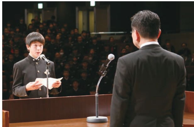
将来の夢や目標を定め、すばらしい未来を切り開いてください！