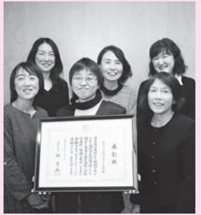
館野小学校 放課後子ども教室

地域学校協働活動において優れた成果を収め、地域と学校の連携・協働の推進に多大な貢献をされた。