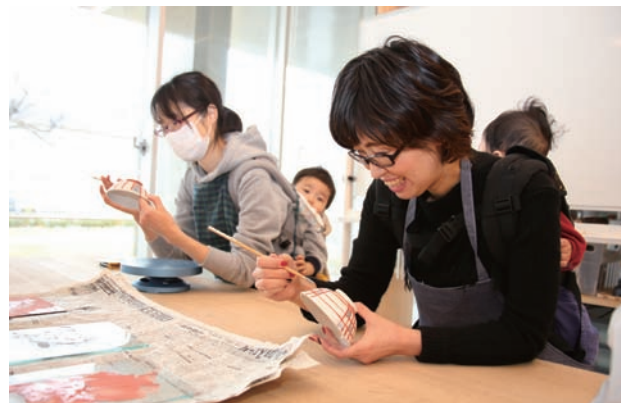
子どもをおんぶしながら挑戦。参加費は財布に優しい500円！

12月15日(金)、学びの杜ののいち カレードにて九谷焼の絵付け体験が行われました。この事業ではカレードの各スタジオを使い、工芸・合唱・生け花・洋画の教室を開催。趣味の活動、略して「しゅみ活」を応援しようというものです。約20人の参加者は、加賀五彩のうち黄土色・草色・えんじ色を使い、ご飯茶碗の絵付けに没頭。「やったことのないものに挑戦したくて来た。現実を忘れて夢中になれた」という声もあり、新たな学びの楽しさを発見する時間となりました。