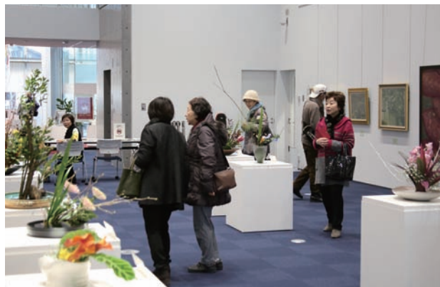
館内はまるで美術館のような雰囲気でした。