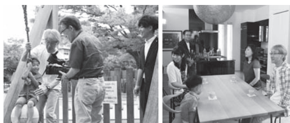
撮影風景 (中央公園)