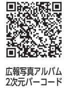
広報写真アルバム 2次元バーコード

また、深圳小学の児童は市内で水引き作りを体験し、その後は兼六園や金沢城なども訪れました。市内の児童宅に宿泊したホームステイ体験では、児童やその家族との交流を深め、4日間で日本の伝統や文化を学びました。