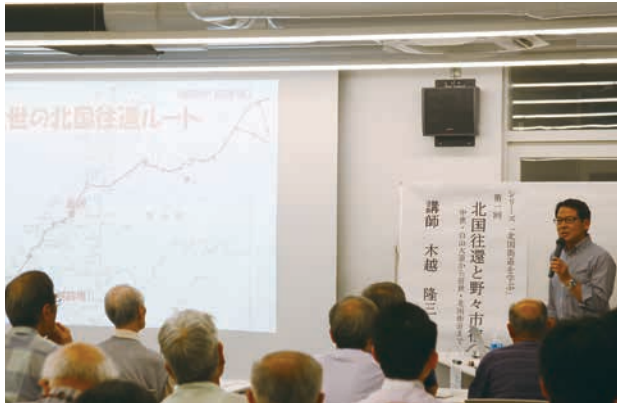
第1回の講義。約80人の参加者は熱心に聞き入っていました。

総会後に開かれた懇親会ではふるさと野々市の思い出話や、会員の近況報告などで盛り上がり、会員同士の親睦がより一層深まる会となりました。