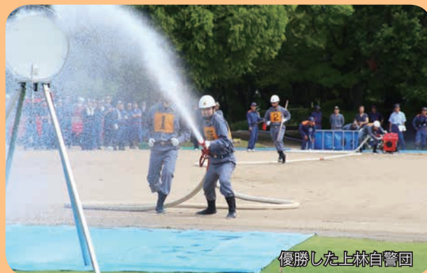
優勝した上林自警団