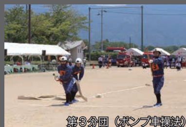
第3分団 (ポンプ車操法)