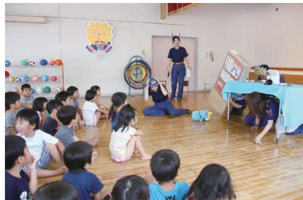
市内8カ所の幼稚園と保育園で開催しました。