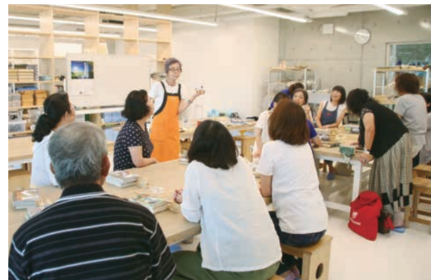
本の修理・修繕について学ぶサポーターの皆さん