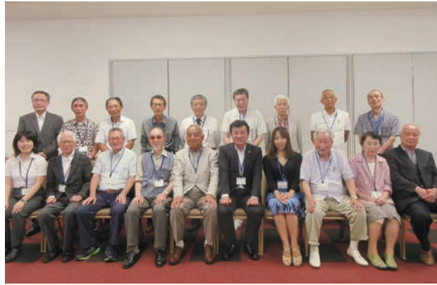
東京野々市会では関東圏在住者の入会を随時受け付けています。