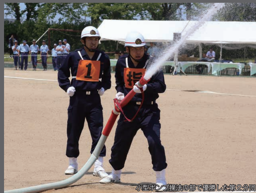
小型ポンプ操法の部で優勝した第2分団