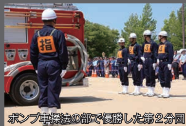
ポンプ車操法の部で優勝した第2分団