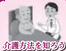
介護方法を知ろう