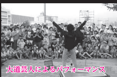
大道芸人によるパフォーマンス

今年のじょんからまつりも盛会に終えることができました。市民の皆さんのご理解とご協力に感謝し、心から御礼申し上げます。