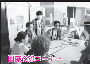
国際交流コーナー