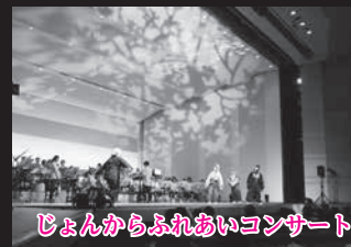
じょんからふれあいコンサート