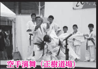
空手演舞(正樹道場)