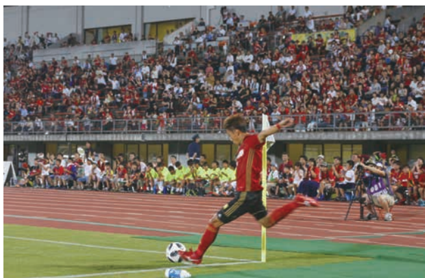
ホームの大声援を受け、最後までゴールを狙いました。

ののいち子ども読書の日の7月23日(月)、学びの杜ののいちカレードでは初の試みとなる大人のための朗読会がありました。大きな照明を落とした夕刻の薄暗い室内、雰囲気のあるランプだけがいくつか灯る中で、参加者18人は聞こえてくる怪しげな話を静かに楽しみました。カレードサポーターが朗読した小泉八雲の『怪談』や泉鏡花の『蓑谷』などは効果的なBGMや光の演出も相まって雰囲気抜群。参加者らは口々にとても良かったと話し、好評を博したイベントとなりました。