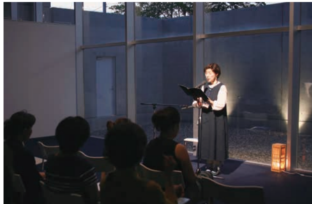
気持ちの入った語りで私たちを奇怪な世界へといざないます。