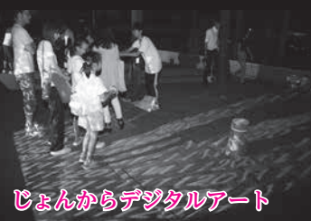
じょんからデジタルアート