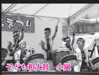
子ども和太鼓 小嵐