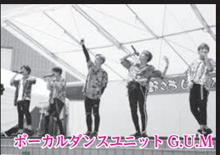
ボーカルダンスユニットG.U.M