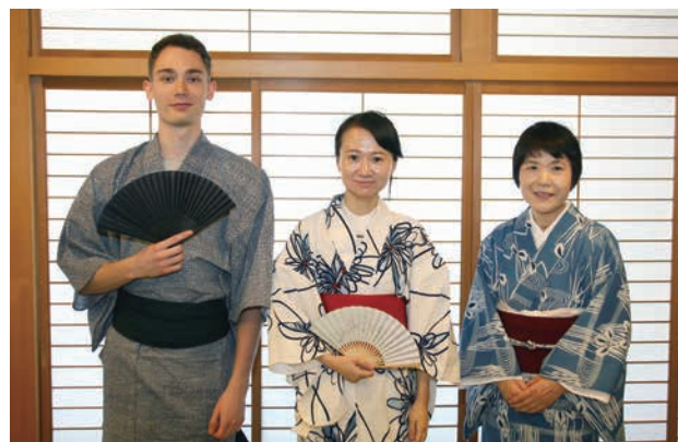
涼しげなきもの姿がとっても似合っています。