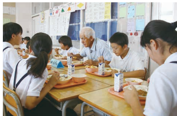
おいしいカレーに夢中！あっという間に食べ終わりました。

7月20日(金)、市内小中学校の給食で野々市産の野菜を使ったサマーカレーが登場しました。サマーカレー給食は、地元の食材を通じて地域の自然や文化への理解を深め、食に対する感謝の気持ちを育むために平成18年から実施しています。今年は隠し味に翠星高校の生徒が作ったヤーコンジャムが使われました。菅原小学校では6年生の児童が野菜生産者や翠星高校生徒と交流。児童からは「野菜が甘くておいしかった」「苦手な野菜も食べやすかった」と満足の声が聞かれました。