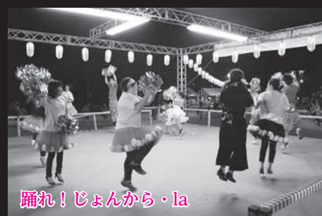
踊れ!じょんから・la