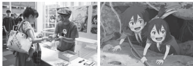
多くの人が集まったサイン会