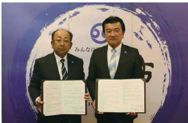
今回の協定締結で、市の災害協定締結数は48となりました。

7月下旬から8月上旬の4日間、学びの杜ののいちカレードでこどもミュージアム2018が開催されました。ののいちがぐドットネット運営委員会が主催したこの催しには4日間で約90人の小学生が参加。他校の児童との交流に戸惑う子もいましたが、一緒に音楽バンドを組んだり、カメラマンになって果物や友達の写真を撮影するなど、体験を通じてすぐに打ち解けました。単に体験するだけでなく、みんなの前で発表する場面もあり、子どもたちは大きく成長したようでした。