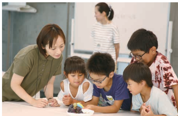
発表に使う写真はみんなで意見を出し合って選びました。