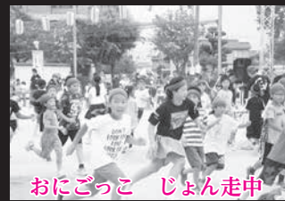
おにごっこ じょん走中