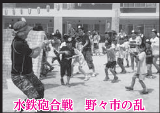
水鉄砲合戦 野々市の乱