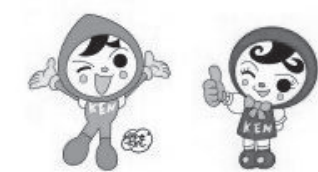
人権イメージキャラクター人KEN まもる君と人KENあゆみちゃん

期 間 8月23日(水)～29日(火) 相談の時間 【平日】 8:30～19:00 【土日】 10:00～17:00 ※通常は平日 8:30～17:15 電 話 番 号 0120-007-110（全国共通フリーダイヤル）