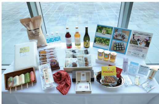
ふるさと納税返礼品

A は、事業費が増加した理由として、返礼品の調達・送付に係る費用、広報に係る費用、委託関係等に係る費用が増額したため。総務省が発表している前年度の寄附控除額は、市税分で1億4千万円余り。寄附金額が増加した要因としては、返礼品数の拡充と、運営会社の増加によるもの。