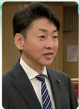
西本 政之 議員 (無党派)