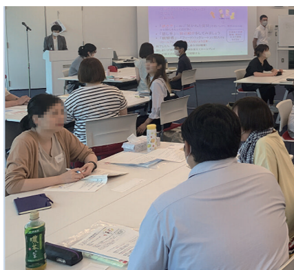
市民カウンセラー連続講座

A 第1回の講座修了生が市民力カウンセラーの会「ほわっと」を結成しており、毎回、講座の修了式で入会の案内をしている。「ほわっと」は市民活動センター登録団体としても活動しており、市民活動センターで定期的に相談窓口を開設している。