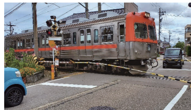
写真=北陸鉄道石川線(野々市市本町地内)

Q 旧大倉外科医院跡地利用について、県道野々市鶴来線本町交差点の右折車線を確保する道路改良を進めたいとのことだが、旧大倉外科医院跡地部分での改良だけでは変則的で十分なものになる恐れがある。4方向で十分な幅の歩道を設けるなど、中長期的な計画で抜本的な改良を行う必要があるのではないか。