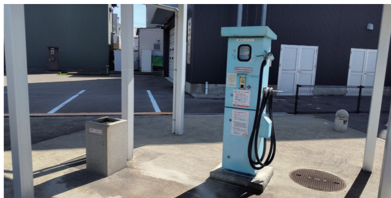
温泉スタンド（田尻町地内）

A 営業開始から今まで大きな故障もなく営業してきている。温泉スタンドは市の資源と捉えており、施設が使える間は維持していきたいと考えている。大きな故障等があった、多額の費用がかかることになった場合は、今後の方向性を考える。