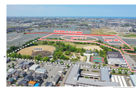
中央公園拡張整備事業 計画イメージ

Q ローカルPFI事業の推進 や今後計画される中央公園 拡張整備事業での手法について検討 はされているか伺う A 市長 ●ローカルPFIは、主 な特徴として、地域の企業が