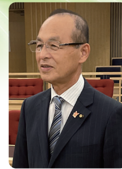
岩見 博 議員 (日本共産党)