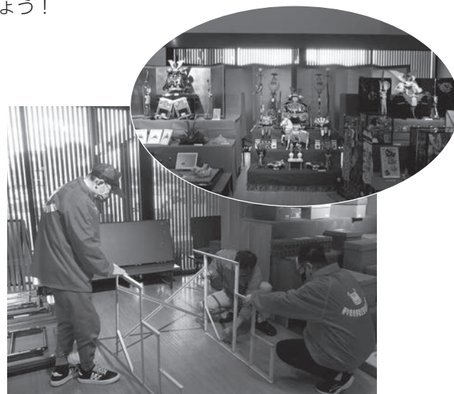
五月人形の展示の様子