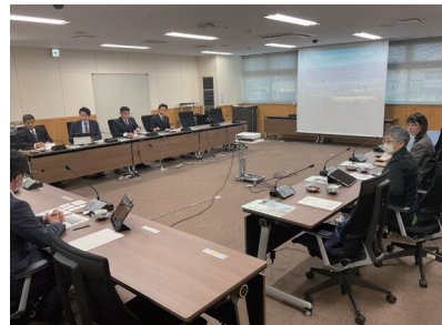
飯田市議会での視察

報告会開催までの経緯、報告会・意見交換会の概要、開催実績、市民からの意見書の取り扱いについて、情報収集を行った。総括として、地域のまちづくり委員会と連携し、多くの市民が参加した報告会、意見交換会となっている。これまで「中学校のトイレの洋式化」、「地区児童クラブの施設改善」、「いいだ子育て応援アプリの提供」など市民の意見を取り入れた政策を実現しており、意義ある議会報告会であると感じた。また、意見交換会では、テーマを設定して開催しているため、それぞれ市民にとっては興味がないテーマの場合、意義のある意見交換会としていくために、どのように解決していくかについて今後の課題としていた。