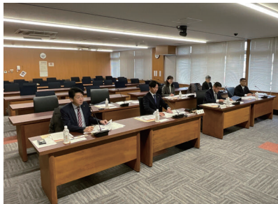
伊勢市議会での視察

高校生議会の主旨、高校生の対象と質問内容、開催までの流れ等について情報収集を行った。企画立案から各校への参加依頼、答弁資料の作成や議会開催まで全て運営を市議会議員が手分けをして対応しているとのことであった。また、質問作成に関しても、基本、高校生側に一任しており学生の主体性を尊重すること等、若者の育成をすることについて参考となった。