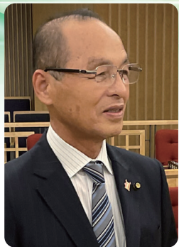
岩見 博 議員 (日本共産党)