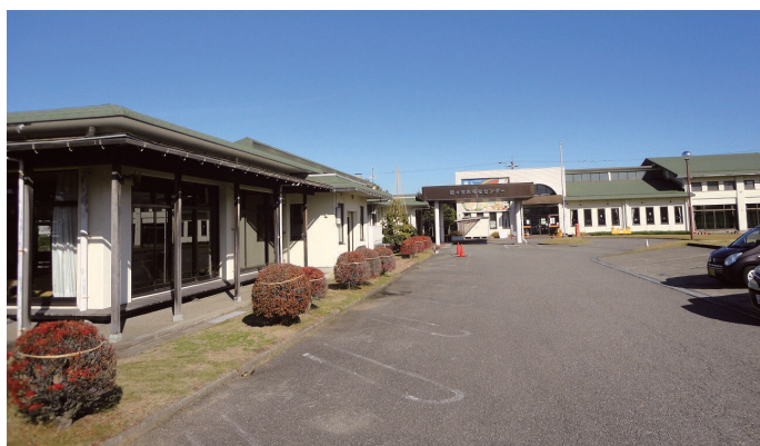
（仮称）野々市つばきの杜センター整備予定地（矢作三丁目）

Q 野々市中央公園拡張整備事業として2億400万円が令和6年度予算額に計上されており、用地取得は令和8年を目指している。と聞いているが、令和6年度は何割程度を取得するのか。