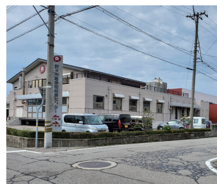
学校給食センター (太平寺3丁目)