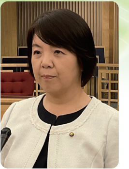
木谷 直子 議員 (公明党)