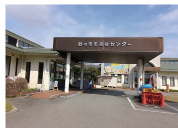
輪島市の方が避難されている 老人福祉センター椿荘

A 市長 ● 県や社会福祉協議会と連携することで、避難者の孤立が解消するよう、継続的な支援を行う。