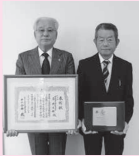
市交通安全協会 富奥支部

交通安全運動推進に尽力され、交通安全思想の普及徹底と交通事故の防止に貢献された。