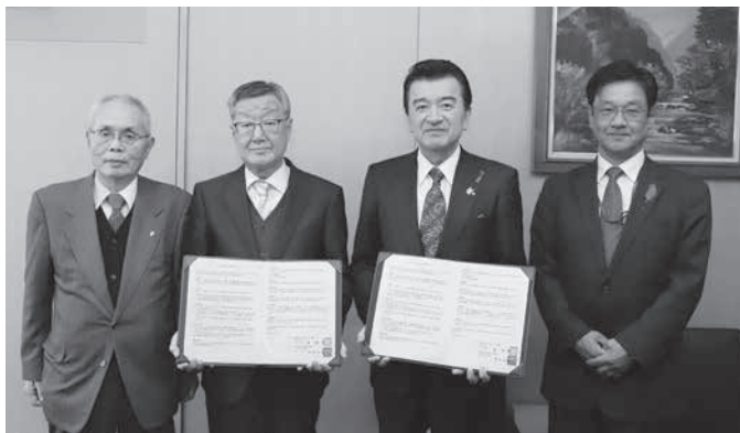
協定書に署名する栗市長と渡部会長