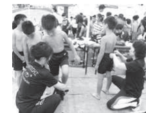
小学生すもう大会でのまわしの着用補助