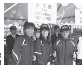
野々市市マラソン大会での受付