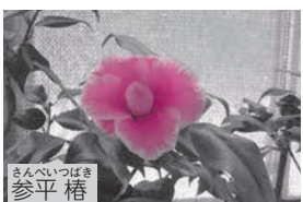
さんべい 参平 椿