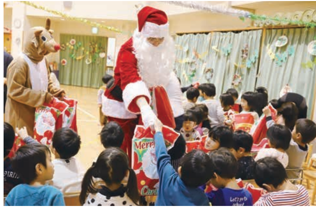
サンタさんから園児一人一人にプレゼントが手渡されました。