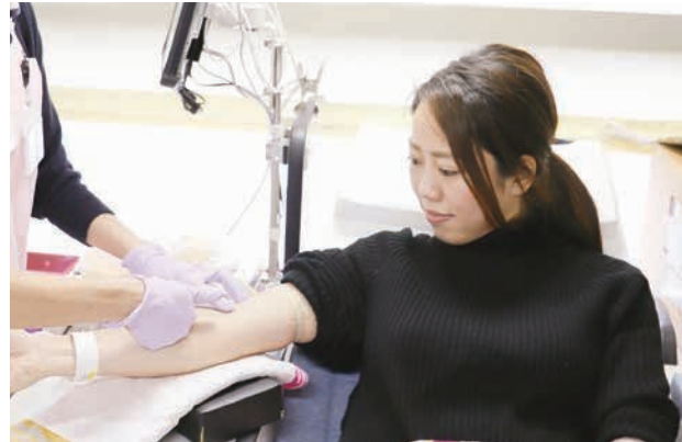
冬は血液が不足しがち。献血で誰かのヒーローになろう！

12月20日(木)、押野保育園にサンタクロースとトナカイのルドルフがやってきました。園児がクリスマス会を行っていたところ、突然サンタが登場。大喜びの園児はサンタと一緒にジングルベルなどの音楽に合わせて踊り、楽しい時間を過ごしました。いつもすてきなプレゼントをくれるサンタに感謝を込めて、園児からサンタへの逆プレゼントも実施。園児は「サンタさんに会えて、プレゼントももらえてうれしかった」とサンタとの出会いに大満足の様子でした。