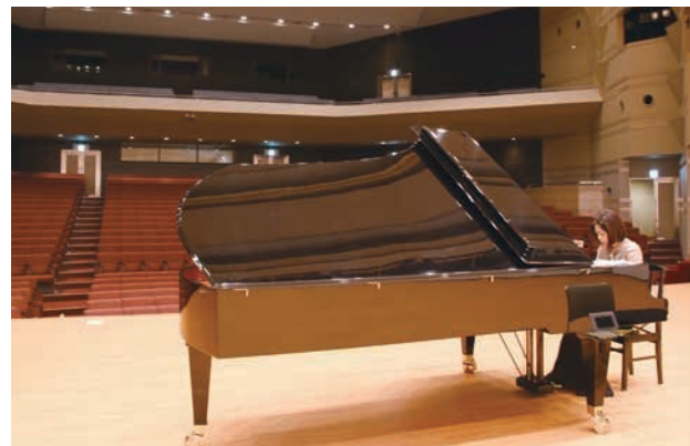
大きなホールで思う存分にピアノを弾くことができました。