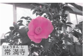
じょうまん 常満 寺