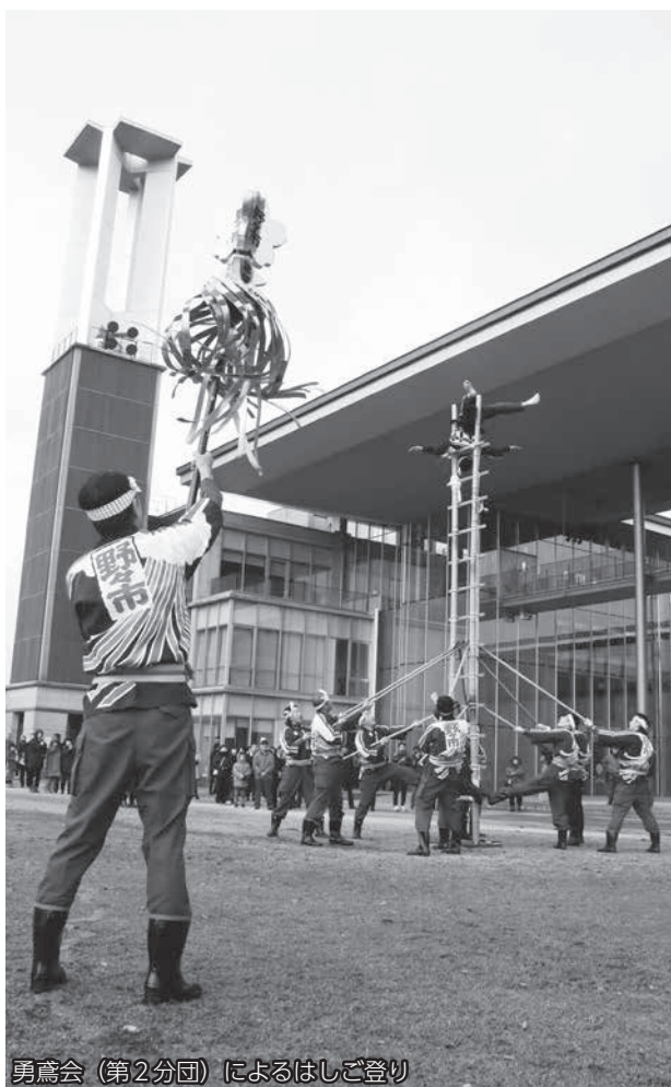
勇鷹会（第2分団）によるはしご登り

式典に引き続き、あらみや公園で は、無火災を願い、消防車両行進、 はしご登り、放水式が披露されまし た。寒空の下集まった約350人の 観衆は、団員たちの勇壮で頼もしい 姿に拍手と歓声を送っていました。