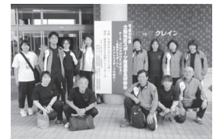
女性も多数活躍しています！