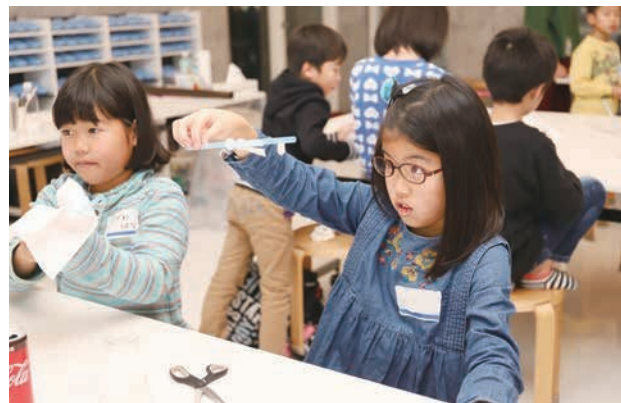
静電気を利用した不思議な現象に興味津々です。

1月14日(月・祝)・15日(火)の2日間、文化会館フォルテが所有する希少なピアノ「ベーゼンドルファーインペリアル」を自由に演奏できる恒例企画が開催され、参加者はお宝ピアノの深く上質な音色を楽しみました。このピアノから奏でられる音は「至福の音色」と名高く、その音色を大ホールの舞台上で体験することができます。参加者は、「一音一音大切に弾くように心がけた」、「ホールでの響きを味わうことができた」と、特別な時間を満喫していました。