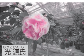
ひかるじん 光源氏