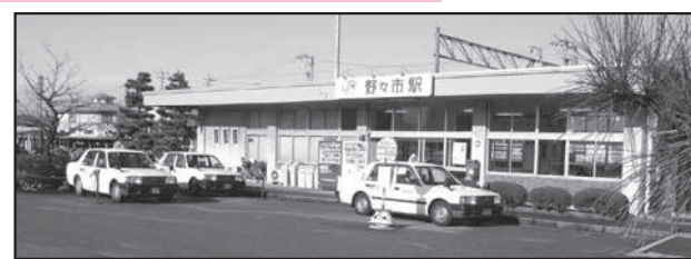
平成9年 JR野々市駅の駅舎 (1997年) 平成9年に、北口プラザ、平成10年には交遊舎を開設。そして平成24年に現在の姿に。