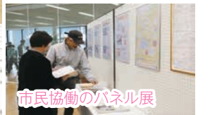
市民協働のパネル展