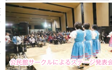
公民館サークルによるステージ発表会