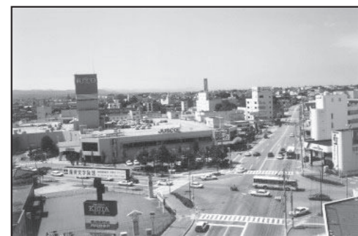
平成4年 (1992年) まだまだ交通量にゆとりがある国道157号線。