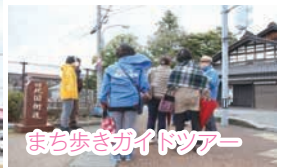
まち歩きガイドツアー