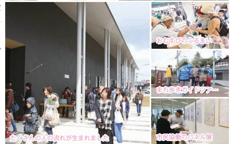
たくさんの人の流れが生まれました