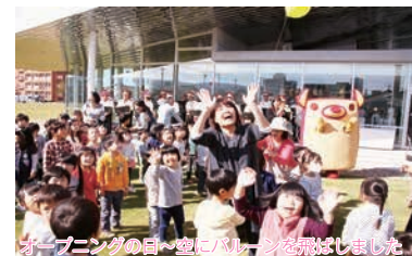
オープニングの日、空にバルーンが舞いました。

本町2丁目地内で開館していた前図書館は、老朽化と蔵書数不足の問題から、新しい図書館への建て替えが長年待ち望まれていました。平成18年に開催した第1回目の新図書館検討会議を皮切りに多くの検討を重ね、ついに平成29年11月1日、太平寺4丁目の旧県立養護学校跡地に、市立図書館と市民学習センターの複合施設「学びの杜ののいち カレード」が開館しました。開館から約1年半の現在、来館者数はなんと72万人を突破。市の顔と呼ばれる存在となっています。