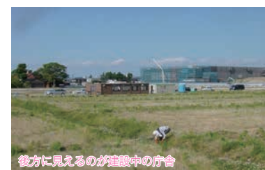
後方に見えるのが建設中の庁舎