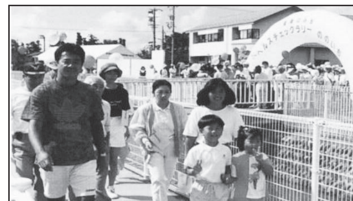
平成5年 今でも多くの人々が散歩やランニングを楽しんでいるウォーキングコース「健康のみち」を設置。