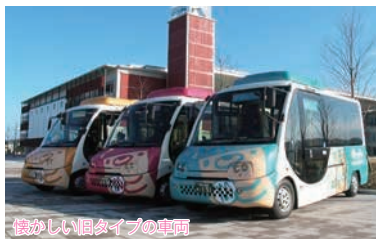
懐かしい低タイプの車両