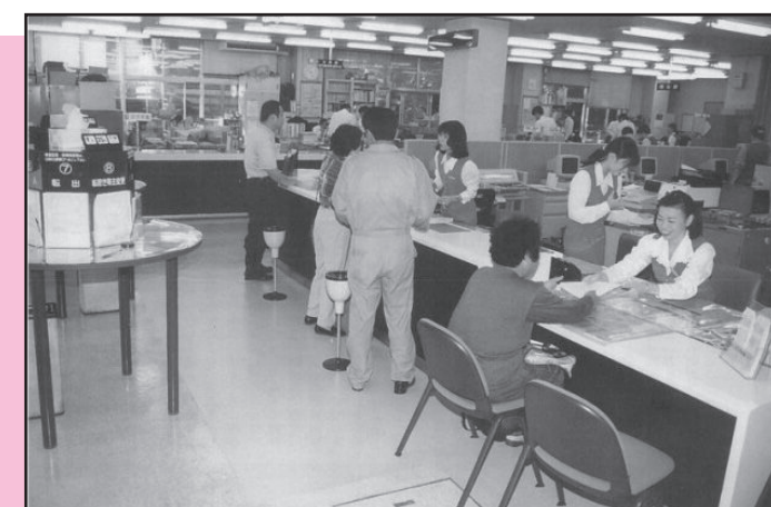
平成7年 旧町役場（本町）の市民課窓口の様子。 (1995年)