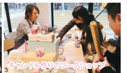
キャンドル作りのワークショップ