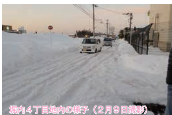
堀内4丁目地内の様子（2月9日撮影）

平成30年1月中旬から2月上旬にかけて、記録的な大雪が北陸地方を襲いました。市内では、50センチを超える積雪を記録し、小中学校の臨時休校、コミュニティバス「のっティ」の運休、ゴミ収集の遅れなど、生活に大きな影響をもたらしました。