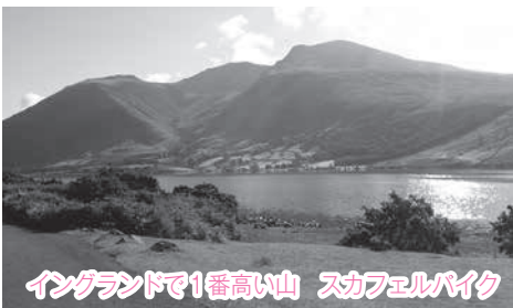
イングランドで1番高い山 スカフェルパイク

初めての試みになりますが、今年の夏は白山に登ろうかなと思っています。頂上に着いたら、今度は野々市から山の方を眺めるのではなく、山から野々市の方を眺めてみたいですね。