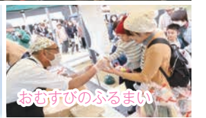
おむすびのふるまい