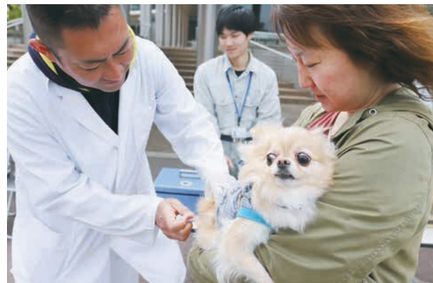
緊張した様子で予防接種を受けていました