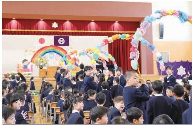
先輩がつくってくれた虹色のアーチをくぐって入場しました。