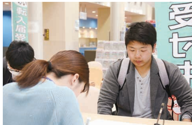
ようこそ野々市市へ。充実した大学生活を過ごしてくださいね。

4月7日(日)、8日(月)の2日間、市内5カ所で狂犬病予防注射を実施しました。市では(公社)県獣医師会の協力のもと毎年この取り組みを行っており、今年は313頭が注射を受けました。おとなしい子や警戒している子などさまざまでしたが、獣医師が犬の体調を見ながら素早く注射を済ませていました。犬を飼うときは、年に1回の狂犬病予防注射が義務付けられています。動物病院でも受けられますので、愛犬のため、また周囲へのマナーとして、必ず予防注射を受けましょう。