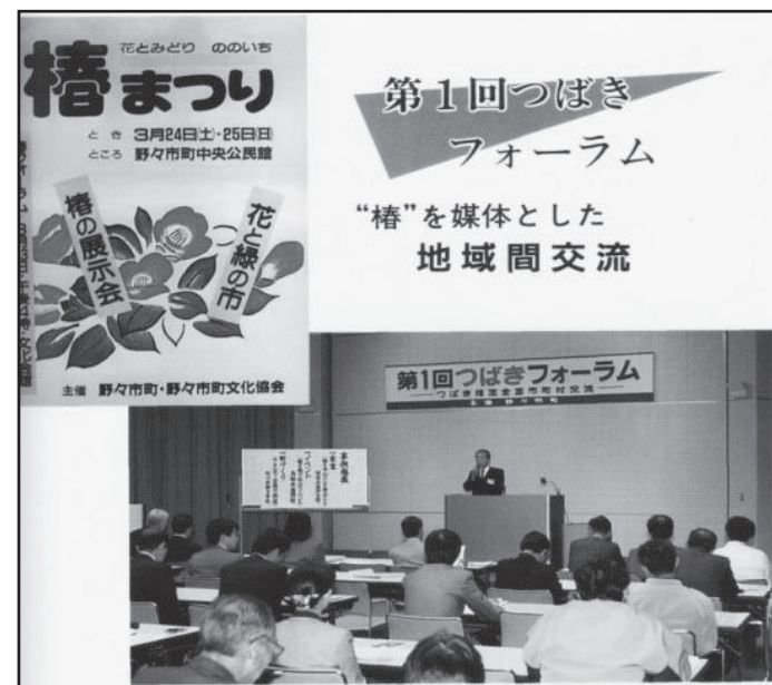
平成2年「全国椿サミット」の前身となった第1回つばきフォーラムを開催し、全国から11自治体に参加。