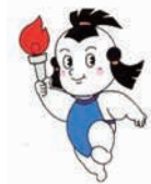
石川国体のキャラクター「元気くん」

全国から10チームが参加し熱戦を繰り広げました。全町内会で炬火リレーコースや沿道の清掃を行うなど、町民が一丸となって選手を迎えました。