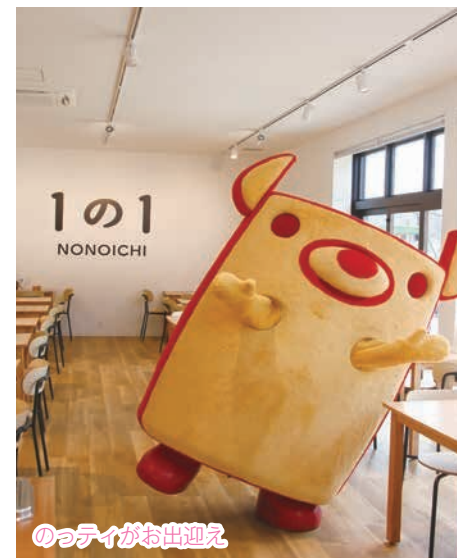
のっティがお出迎え