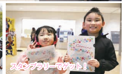
スタンプラリーでゲット！