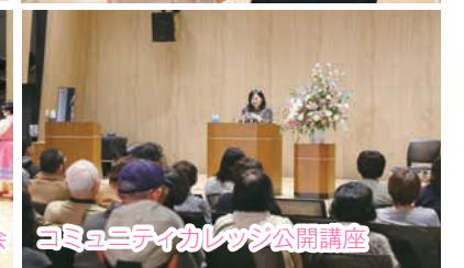
コミュニティカレッジ公開講座