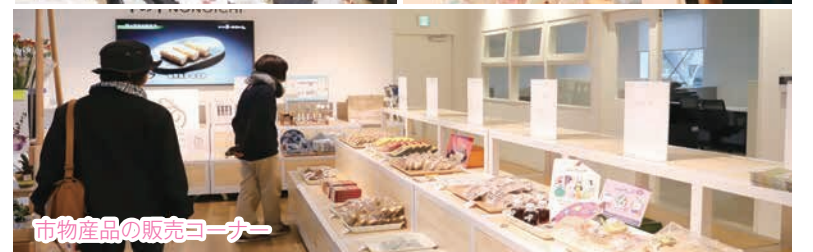
市物産品の販売コーナー