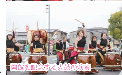
開館を記念する太鼓の演奏