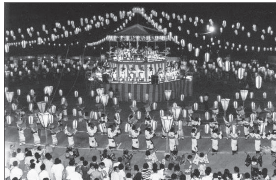
平成2年 (1990年) 旧町役場（本町）周辺で行われていた「野々市じょんからまつり」を文化会館フォルテと野々市小学校周辺に会場を移して初開催。

振り返ると、懐かしい出来事や「え！こんなに前だったの！」と感じる出来事もあるかも。さあ、時間を少し巻き戻して市の平成の出来事を写真とともに振り返ってみましょう。