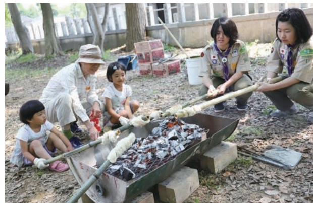
ボーイスカウト野々市第一団では新規団員を随時募集中！