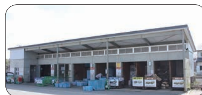
エコステーションの外観

受け入れ対象資源ごみ あきかん、あきびん、ペットボトル、古紙、紙パック、古着・布類 ※容器包装プラスチックは回収していません