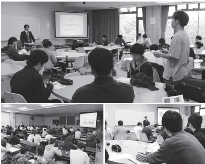
金沢工業大学の各教室で行われた質疑会の様子

今後は8月の最終成果報告に向けて、市の担当者と情報交換を行いながら考えを形にしていきます。学生ならではの柔軟な発想が期待されます。