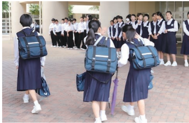
爽やかな朝のあいさつを交し合っていました。