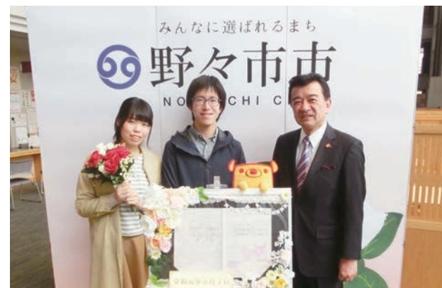
明るく幸せな家庭を築いてください！末永くお幸せに！