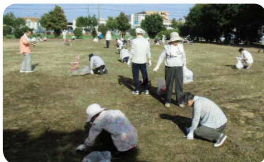
写真は昨年の様子

市では、市民団体である“ののいちっ子を育てる”市民会議が主催する市内一斉の美化清掃が行われています。自分の住む地域の草むしりやゴミ拾いをする事で、地域への愛着も深まります。年に一度、ぜひ参加してみませんか。