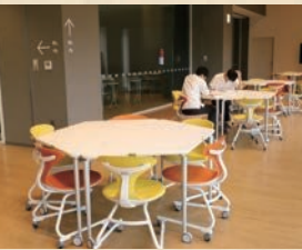
公共棟内の机と椅子

住所 本町2丁目1番20号 【公共棟】 開館時間 9:00～22:00 休館日 毎週月曜日・祝日 ☎ 248-0521 【1の1 NONOICHI】 営業時間 9:00～20:00 休館日 毎週月曜日 ※祝日は営業 ☎ 259-1167