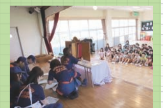
保育園・幼稚園での啓発