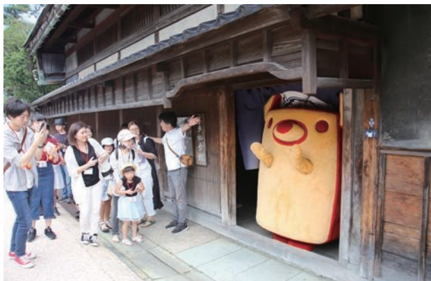
喜多記念館見学の後のはのっティが軒先でお見送り。