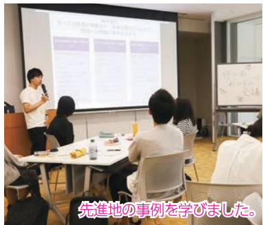
先進地の事例を学びました。