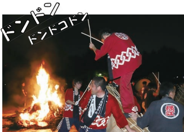
掛け声とともに夜空に響く太鼓の音は、迫力満点です。

7月2日(火)～4日(休)の3日間、野々市中学校の2年生240人が職場体験を行いました。これからの生き方や進路を模索し始める時期に、仕事の大変さや達成感を味わい、自分の将来を見つめる貴重な機会です。市内外の飲食店や小売店、保育園、建設業など82カ所のさまざまな事業所が受け入れ先として協力しています。北陸鉄道では、2人が改札業務を体験。切符への押印や定期券の確認などを行いました。「駅員体験は楽しい。残り2日も頑張ります」と笑顔で話してくれました。