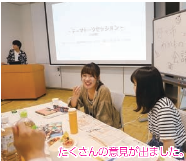
たくさんの意見が出ました。