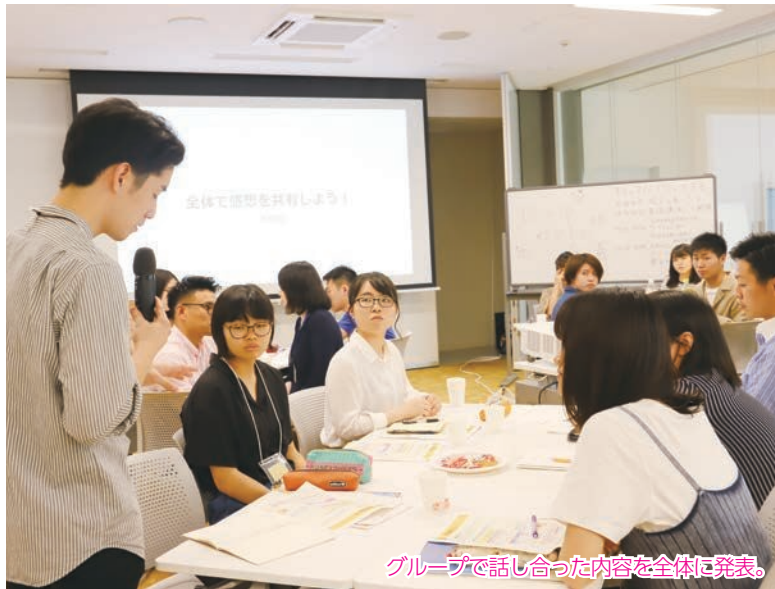
グループで話し合った内容を全体に発表。

先進地での「わかもの会議」の事例を紹介する講演のあと、「住み続けたいまちにするには、どうすればいいか」などのテーマでグループ別に意見を出し合いました。7月23日(火)に再び事前学習会を行い、本会議は8月25日(日)に開催予定です。