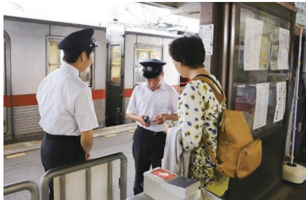
1枚1枚しっかりと確認していました。