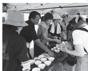
昨年の市防災訓練の様子