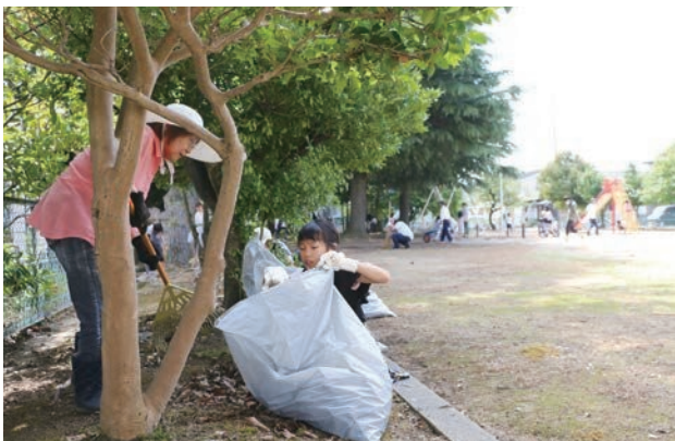
まちも心もすっきり爽やかな朝になりました。