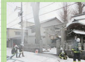
火災防御訓練への参加

日頃、地域に密着した消防・防災活動を行っている消防団。市では、本町・富奥・郷・押野の4地区別に第1～4分団を組織。また、女性団員のみから成る第5分団があります。このまちを、大切な人を守るために消防団員は日頃の訓練・啓発に励んでいます。