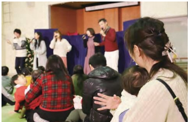
アカペラで織りなす心地よいハーモニーに聞きほれていました。

今回初めて参加した青年部員は、「障子を取りに行ったときに喜んでくれたのがとても嬉しかったです。教えてもらいながらきれいに貼れるように頑張りました」と話していました。きれいになった障子で迎える新年はきっと気持ちのよいものになることでしょう。