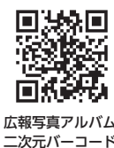
広報写真アルバム 二次元バーコード