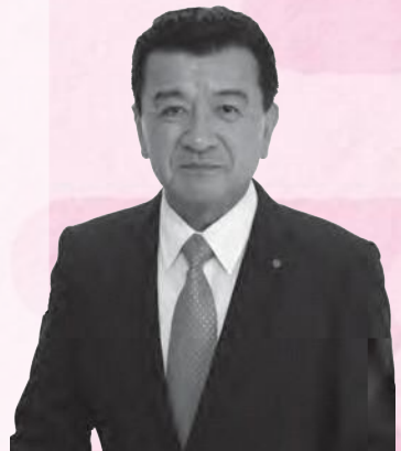
野々市市長 栗 貴章