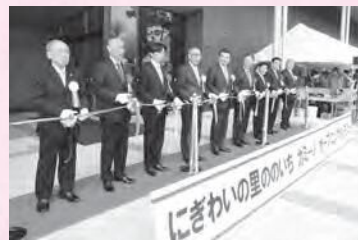
にぎわいの里のいち カミーノ オープニングイベントの様子