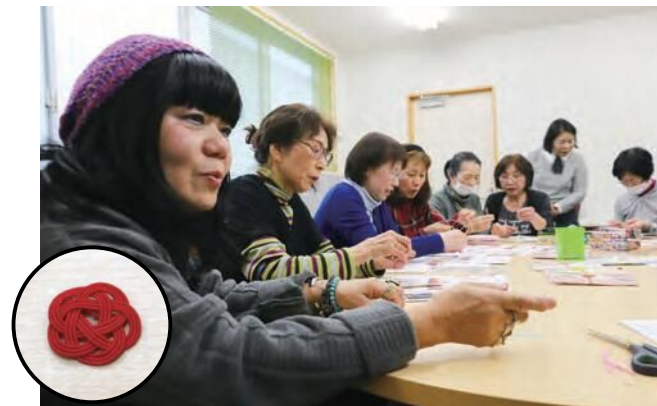
次回2月のちょっとボランティアではひな飾りを作ります。

11月30日(土)、情報交流館カメリアで医師や看護師、介護福祉士など在宅医療に携わるさまざまな立場の人が集まりシンポジウムが開催されました。テレビではあまり報道されない災害時のトイレ事情についての講演の他、自宅で過ごす高齢者をどう支えればよいかをテーマに6人が発表。平成30年の豪雪の際の話など、実際に経験しなければわからなかった事柄を通して、平常時から心掛けるべきことや関わり方などを学びました。