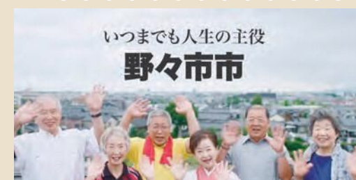
元気な高齢者をテーマに作成した市のPR動画のワンシーン

厚生労働省が発表した「平成27年市区町村別生命表」で野々市市の女性平均寿命の全国第5位にランクイン。この表では、男女別に集計が行われており、女性は88・6歳で全国第5位に、男性は81・8歳と石川県内トップでした。 市中心部から半径10キロ以内に約350の医療機関があることなど、コンパクトな市域に生活に必要な施設が集まっていることがその理由として考えられます。