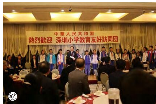
①歓迎式典で記念品を交換(野々市小) ②訪問団をお出迎え(館野小) ③訪問団による息の合った踊りの披露(館野小) ④折り紙に挑戦(富陽小) ⑤自然に笑顔になった自己紹介(館野小) ⑥日中友好晩餐会で訪問団と交流

26日(木)に訪問した富陽小学校では、折り紙で作った力士でのトントン相撲や給食で交流。午後には、館野小学校を訪れ英語の授業に参加しました。英語で書いた自己紹介カードを使った自己紹介やゲームを楽しみ、互いの距離が縮まった様子でした。 滞在期間中、訪問児童16人は市内の8家庭で2泊のホームステイを行い、日本の生活を体験しました。異なる文化との出会いや交流は、双方の児童にとって、かけがえのない経験になったことでしょう。