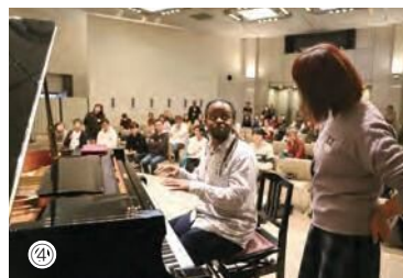
①ジャズボーカリスト、ハービー・トンプソンがムーンライト JAZZ オーケストラと共演 ②大学生グループ“Pseudostudents quartet” ③22日(金)には6人の出演者が菅原小学校を訪問して演奏を披露 ④リズムセクションワークショップの様子