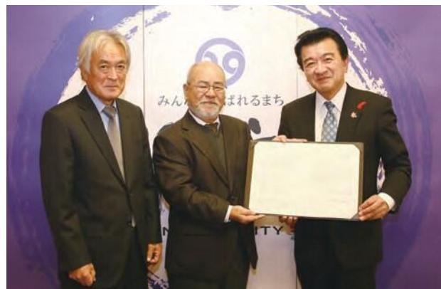
44団体目のアダプトプログラム参加団体となりました。