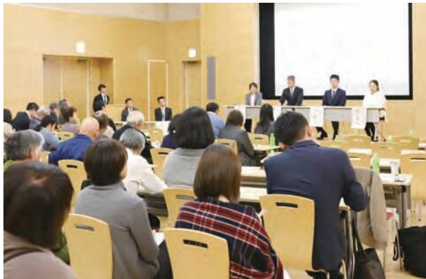
近所で声を掛け合うことも支えあい大切なことの一つです。