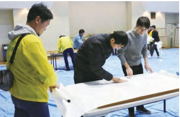
今年から新アイテム「霧吹き」が登場。よりきれいな仕上がりに