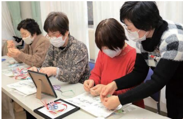
次はどこに通すんだっけ。見ているこちらでも大混乱のあわじ結び