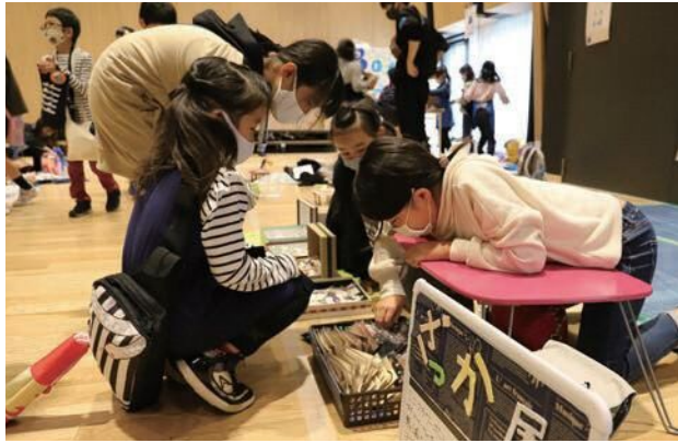
自分で稼いだお金だけに、何に使うかも真剣に考えます。