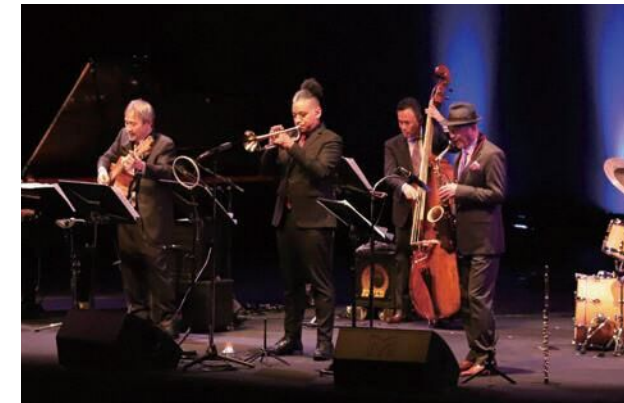
チケットは完売。観客は生で聞くジャズに酔いしれていました。