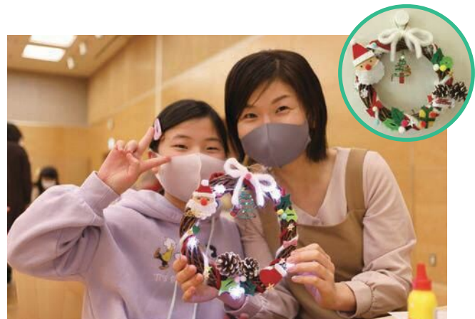
親子で協力してすてきなクリスマスリースができました。

12月12日(土)、LEDライト付きのクリスマスリースづくりが情報交流館カメラで開催され、市内の親子計83人が参加しました。市国際交流員のエドワードから海外のクリスマスの話を聞いた後、フェルトや松ぼっくりなどを使って自由にリースを飾りつけ。布や木の温かくて優しい雰囲気があり、個性が光る作品ができました。最後に、金沢工大 Toiro プロジェクトがプレゼントしてくれた、手作りの「のっティチャーム付き椿ツリー」を中央に取り付けて完成しました。