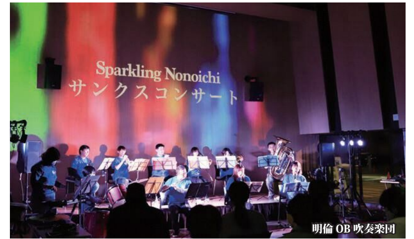
明倫 OB 吹奏楽団

新型コロナウイルスに対応する医療や福祉従事者への感謝の気持ちを光で送る『ののいち GENKI イルミネーションプロジェクト』の一環として11月23日(月・祝)、にぎわいの里のいち カミーノで医療・福祉従事者に向けたコンサートが開催されました。VJ ato(映像演出)が創りだす幻想的な空間の中で3組のアーティストが順に曲を披露し、約70人の観客が刺激的な音と映像美に酔いしれました。出演者は「人前で演奏機会が減っていたので久しぶりに演奏出来て楽しかった」と話し、終始にぎやかなコンサートとなりました。カミーノのイルミネーションは2月末まで点灯しています。皆さんも足を運んでみませんか。