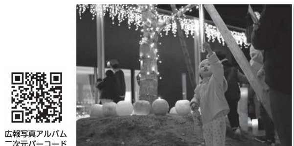
広報写真アルバム 二次元バーコード

今月の表紙 今月の表紙は、「Sparkling Nonoichi」点灯式での一枚です。イルミネーションとランタンに囲まれ、興味深そうに光に手を伸ばす子どもの様子を写しました。「医療・福祉従事者へ感謝の光を」という目的に多くの団体が協賛し実現したカミーノのライトアップ。ぜひ一度訪れてみてください。