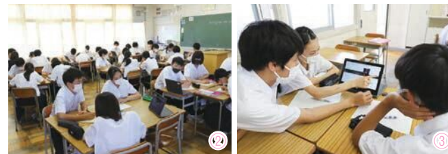
①、②グループごとにタブレット端末を利用してオンライン講演会を受講しました。③講師からの質問には、チャット形式で回答します。④画面を通して講師への質問を行う生徒。