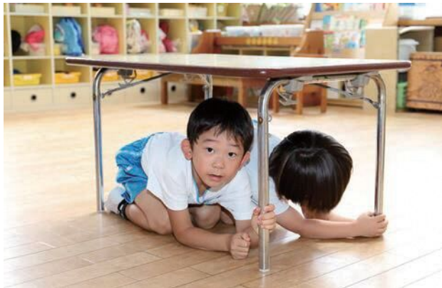
地震の際、まずは落下物から頭を守ることが大切です。