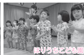
ほりうちこども園