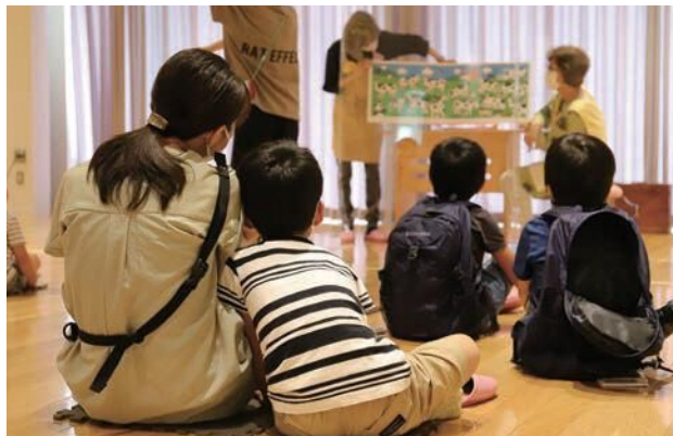
8月のおはなし会は7日(土)、21日(土)、28日(土)に開催予定です。

7月7日(水)の午前11時に県下で一斉に行われたシェイクアウトいしかわに合わせ、市立富奥保育園でも地震の揺れから自分の身を守るための訓練が行われました。11時に地震発生を知らせるサイレンが鳴ると、園児らは素早く机の下でダンゴムシのポーズをとります。机がずれないようにしっかりと脚を握り、先生の指示を聞きながら大きな揺れに備えることが出来ました。普段から避難することに慣れるため、毎月地震と火災に備えた避難訓練を交互に行っているそうです。