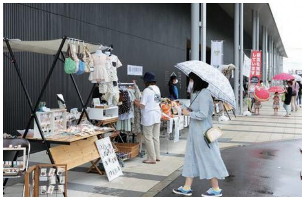
理解し合える関係から、優しい地域づくりを目指します。

6月27日(日)、市内にある無印良品、のっぽくん、ふがく堂、カミーノの4つが手をつなぎ、多様性をテーマにマルシェを開催しました。あいにくの梅雨空での開催となりましたが、障害者や外国人、若者、子どもなどを支援する多くの団体が集まり、4つの会場には魅力溢れる数々のブースが軒を連ねました。珍しい多国籍グルメに舌鼓を打ち、かわいい雑貨販売にウキウキするなど、2回目の開催となった今回も多くの家族連れでにぎわいました。