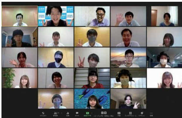
「自分でできることがもっとある」という感想が印象的でした。