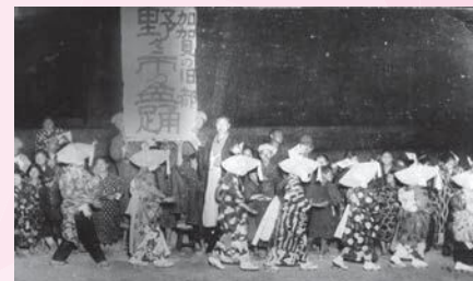
踊り流しの様子（大正期）

国を中世の頃に治めていた武士である富樫氏の善政をたたえつつ、武士や町人、百姓などの区別なく踊り明かしたという説、長崎県平戸に伝わる豊年を祈る念仏踊り「自安和楽（自ら安んじて和やかに楽しむ）」という意味の「ジャンガラ」のことを起源とする説などがありますが、いずれも確かなものはありません。戦後になると、民俗芸能への関心が高まり、じょんから節はより洗練された踊りや芸風を目指して楽曲や衣装にも工夫が凝らされるように。現在の野々市じょんからまつりの踊り大会で見られるような姿になりました。