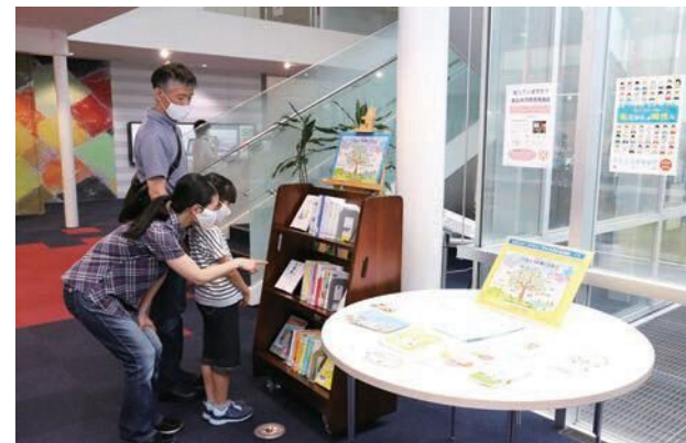
料理は誰がするの？掃除は？身近な場面から考えてみよう。

6月23日(水)から始まった男女共同参画週間にあわせて、市男女共同参画推進員の発案による啓発コーナーが6月17日(日)からひと月の間、学びの杜ののいち カレードに設けられました。皆さんには女性は家庭を守るものとか、男性は外で働き家族を養うものなどの意識はありませんか。「男らしさ」や「女らしさ」に縛られて、やりたいことや言いたいことを我慢していませんか。ジェンダーバイアスを取り除き、個性としての「私らしさ」を尊重できるまちを実現したいですね。