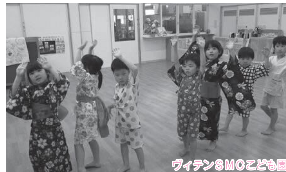
ヴィテンSMCこども園

あすなろ保育園 アリスこども園 ヴィテンSMCこども園 幼保連携型認定こども園 エンジェル保育園 御経塚保育園 押野保育園 富奥保育園 幼保連携型認定こども園 はくさん保育園 ほのみこども園 ほりうちこども園 幼保連携型認定こども園 和光