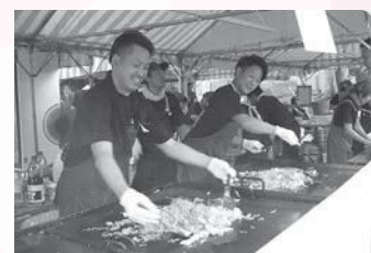
チームワークの良さもおいしさの秘訣

います。調味料の量、蒸しのタイミングなどを歴代の先輩から大切に引き継いでいます。まつりの2週間前には、鉄板を使って本番と同じ環境で練習して、部員の技術向上と味の確認を行います。部員たちの熱い思いがこもった青年部伝統の味です。 —— 来年のまつりに向けての思いを聞かせてください。 暑い野外での調理でへとへとになりますが、次の年にまたやりたいと思うのは、まつりの成功のために部員が一人丸となって取り組んだ達成感、そして焼きそばを喜んでくれる皆さんがいるからです。来年は部員一同「やっとな焼ける」「焼きそばを待つとるやつがおる！」の気持ちで、焼きますのでぜひ食べに来てください。