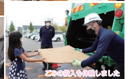
ごみの投入も体験しました