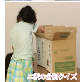
二つの分別クイズ