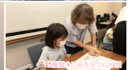
12種類のごみを8つに分類