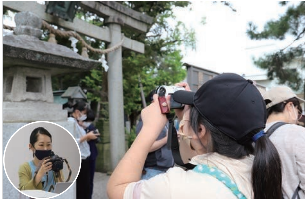
中乃波木氏の写真展も19日(火)までカレードで開催しています。