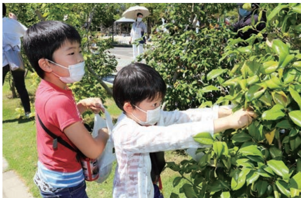
お土産にはツバキを使ったパンやクッキーが配られました。

8月29日(日)、野々市中央公園でツバキを学び、油を搾るための種の収穫体験がありました。主催したのは市民活動登録団体のe-やん。昨夏に行った「つばきをまるごと知ろう」を発展させ、ツバキから油を搾る体験を通して、ツバキのまちづくりに貢献したいという思いから企画されました。残暑の厳しい中、大きくまるまるとしたツバキの実を、10組の親子が夢中になって収穫していました。12月にはいよいよ搾油体験とツバキ油の活用について学びます。楽しみです。