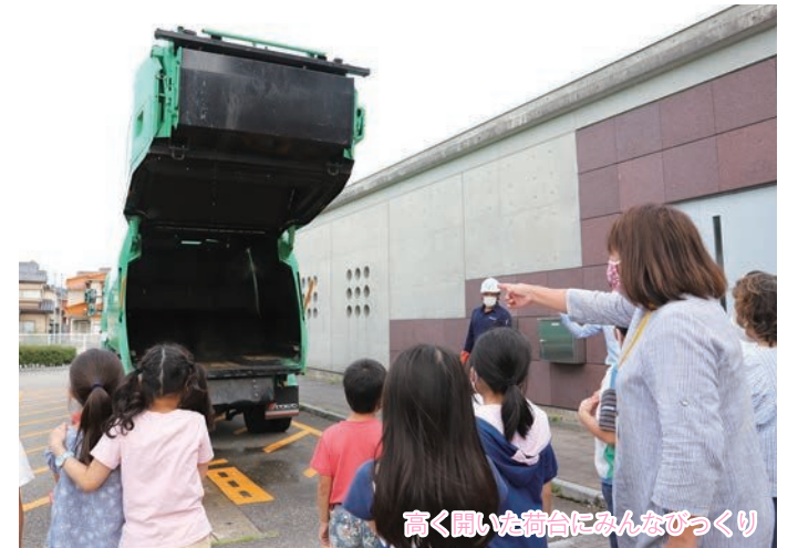
高く開いた荷台にみんなびっくり

放課後に、子どもたちが地域のボランティアと一緒にさまざまな体験活動を行う放課後子ども教室。2つの小学校や学びの杜ののいち カレード、にぎわいの里ののいち カミーノ、こどもセンターの5教室があり、元気いっぱい活動しています。その一環で、ごみの分別やリサイクルについて学ぶ教室が行われました。ポテトチップスの袋、新聞紙や傘など身近なごみを8つの分類に分けるごみ分別検定に挑戦し、市のごみ収集運搬を行っている株式会社トスマク・アイの協力のもと、リサイクルの流れを学びました。9月13日(月)に行われたこどもセンター教室では、市役所裏に実際の収集車が登場。一台で集積場60～70カ所分のごみを集めることができるという大きな車体を近くで見た子どもたちは大興奮の様子でした。