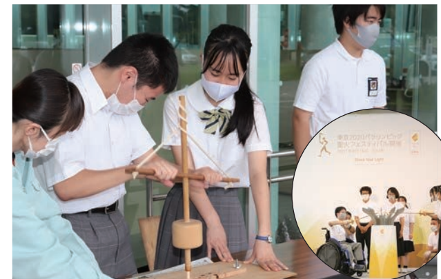
またとない貴重な体験に、生徒は熱心に取り組んでいました。