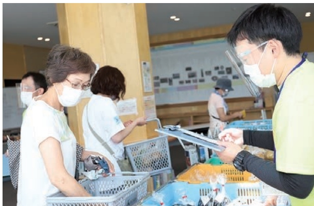
梨も3種類あり、人気の「幸水」はあっという間に完売。