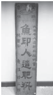
魚住家の「人造肥料」の看板

野々市の魚住家は「ようや」という屋号で食品や肥料を売る商売をしていました。建物に入っすぐのミセノマとよばれる部屋では、こんかにしん、野菜、菓子をはじめ、台所用品や紙・墨・炭・油などがたたるや陳列台に並んで売られていました。東京に本社があった大日本人造肥料株式会社の化学肥料を取り扱う店であることを示す大正から昭和時代初期の看板も残っており、まちの雑貨屋さんとして昭和 48(1973) 年まで、野々市のにぎわいを支えていました。