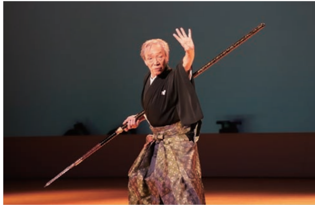
同会は、野々市・郷・富奥公民館で日々稽古に励んでいます。

10月10日(日)、市伝統芸能吟剣詩舞会が市制10周年を記念し「吟剣詩舞で綴る 北国街道物語」を文化会館フォルテで開催。会場には約300人が訪れ、伝統芸能の世界を堪能しました。公演名でもあるオリジナルの構成演舞では、北国街道を取り巻く人々の営みや想いが「白山を望む」「あゝ七尾城」「安宅の関」などの演目で剣詩舞に乗せて綴られました。また、県内の吟詠・剣詩舞団体などの賛助出演や「ののっこ太鼓 小嵐」による太鼓演奏の披露もあり、会場を大いに湧かせました。