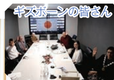
ギズボーンの皆様