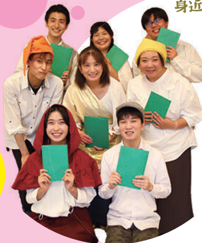
野々市市民劇団 nono の 皆さん

皆さんに演劇を身近に感 じてもらい、気軽におしば いに参加してもらえるよう になったらいいと思います。 新メンバーを絶賛募集 中です！