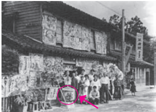
開店記念祝いに贈られた「猩々」

所在地 本町三丁目 8-11 開館時間 9：00 ～ 17：00 入館料 大人 400 円 子供 200 円 ※団体（10 人以上）は 100 円引き 休館日 月曜（祝日の場合はその翌日）