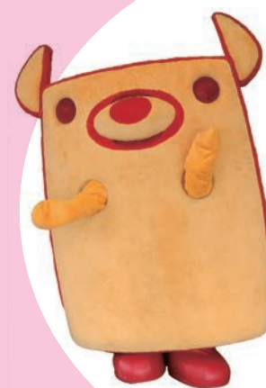
市公式キャラクター のっティ

祝・野々市市制施行 10周年(ノ)・ω・(ヾ) この10年間は、イベントに 行ったときとかにみんなに たくさん遊んでもらったし、 Twitterでもたくさんの人 とお友達になることができ たの(* 'ω ' = 三 = 'ω '*) これからも野々市とみん なをつなぐ架け橋になって、 野々市をもっと盛り上げて いきたいの！10年後は、 野々市もぼくももっと有名 になっていたらいいなー！