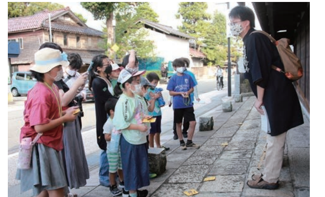
訪れた場所に手作りの黄色い肉球マツを置きました。

10月9日(土)、ボランティアガイドののいち里まち倶楽部が、旧北国街道である本町通りに残されたネコの謎をたどるイベントを開催しました。昨年、御園小の6年生103人が授業で提案したにぎわいづくりのアイデアを実現したもので、タイトルの「103匹」には103人の子どもたちの人数を重ねました。参加した約50人の児童たちは、照台寺の「虎猫御書」にまつわる紙芝居や、通りの民家に残る「猫面瓦」探しなどを通して、通りに残されたまちの歴史を楽しく学びました。