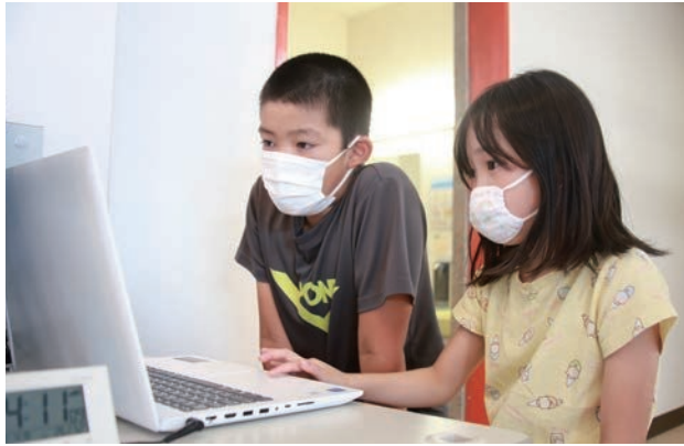
「1回15分まで」というルールを守って楽しく利用しています。