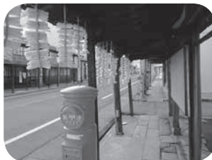
【上越高田コース】 高田の雁木の街並み

日時 10月6日(土) 6:00～19:15 内容 高田の雁木の街並み散策・関川の関所見学 りんご狩りなど 参加費 9800円(昼食代込み)