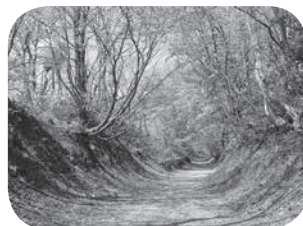
【東金沢・津幡コース】 歴史国道北陸道